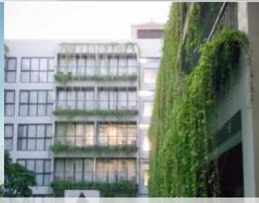
Neo+ Hotel Legian Kuta, Bali