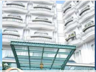
Noor Hotel Bandung, Jawa Barat