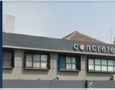
Concrete Co-Working Space Jakarta