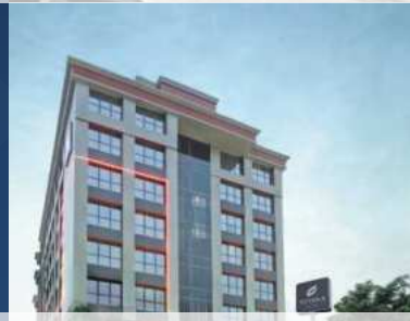
Asyana Hotel Jakarta