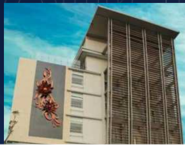
Crystal Lotus Hotel Yogyakarta