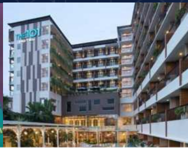
The 101 Hotel Yogyakarta