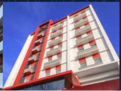
Red Planet Hotel Makassar, Sulawesi Selatan