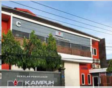
Kampuh Welding Surabaya