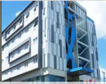
Zenith Hotel Kendari, Sulawesi Tenggara