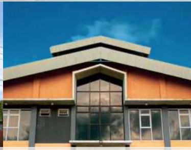
Kampuh Welding Cikarang