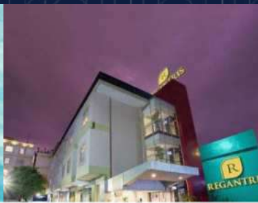
Regantris Hotel Yogyakarta