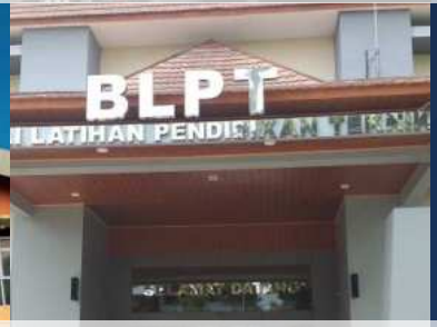
Balai Latihan Pendidikan Teknik (BLPT) Yogyakarta